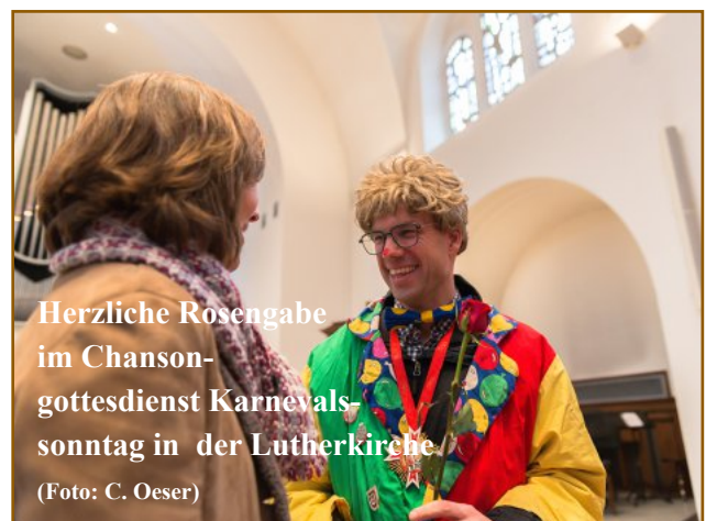
Herzliche Rosengabe im Chanson- gottesdienst Karnevals- sonntag in der Lutherkirche

Regelmäßige Kreise, Veranstaltungen, weitere Angaben und Kontakte finden Sie auf unserer Homepage www.lutherkirche-bonn.de , den aktuellen Gemeindebrief ebenso. Zudem liegt 14-tägig für Sie "Lebendige Lutherkirche Aktuell" zu den Gottesdiensten bereit.